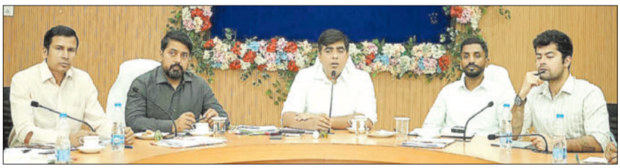
अधिकारियों की बैठक लेते कलेक्टर।

कलेक्टर ने बताया कि 1 मई से 10 जून तक शहर के वार्डों तथा