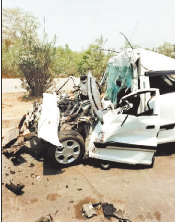
दुर्घटना में क्षतिग्रस्त वाहन।