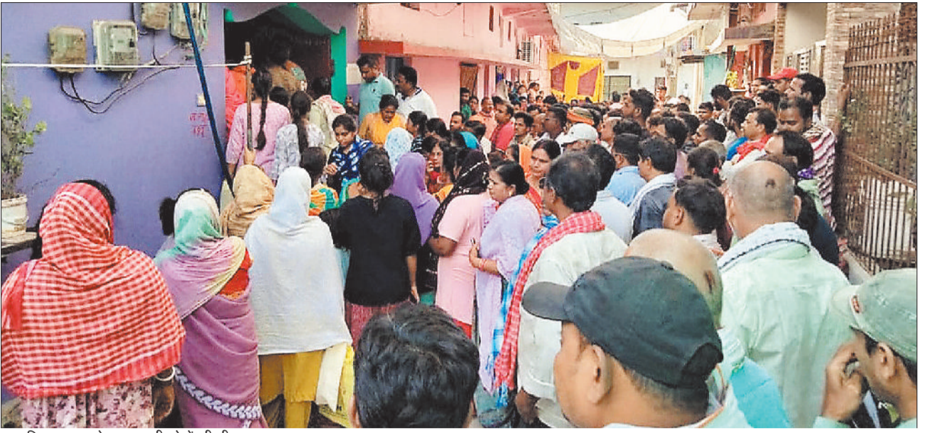
निवास स्थान के बाहर लगी लोगों की भीड़।