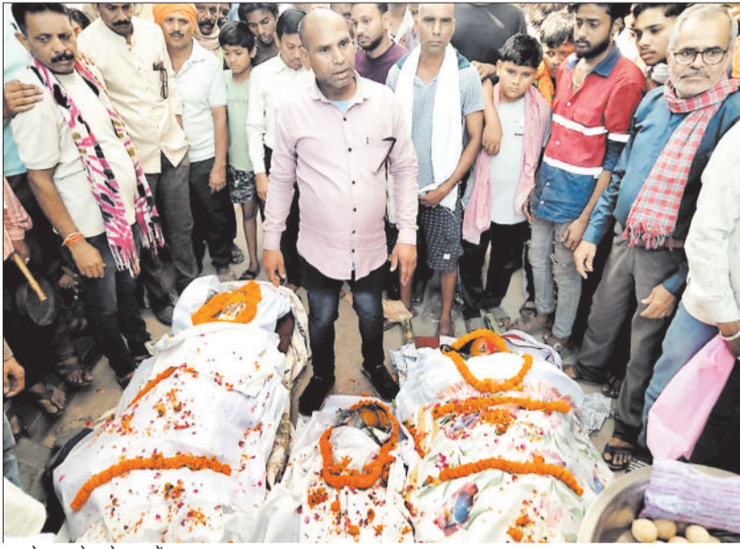
घर के सामने रखे मृतकों शव।