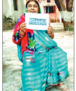
धरने में बैठी पीड़ित की मां।